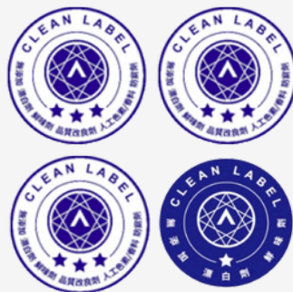
【2024年A.A.無添加潔淨標章】

益比喜白金蛋白(金)、高鈣凍(金)、悠犀利(銀)、 Simply夜酵飲(銅)、夜酵素DX(銅)、 夜酵素NMN(銅)、食事油切酵素EX(銅)