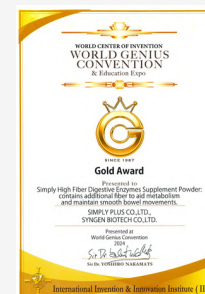
Simply 野菜多多酵素粉 金牌 【第38屆日本創新天才 國際發明展】