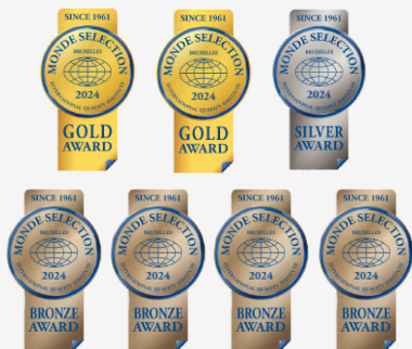
【第60屆 比利時世界品質評鑑大賞】

益比喜白金蛋白(金)、高鈣凍(金)、悠犀利(銀)、 Simply夜酵飲(銅)、夜酵素DX(銅)、 夜酵素NMN(銅)、食事油切酵素EX(銅)