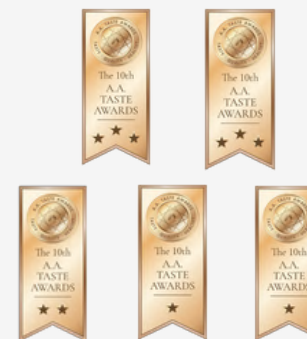
【第10屆A.A.全球純粹品味評鑑】