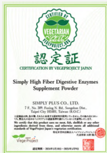
Simply 野菜多多酵素粉 【奶素認證標章】