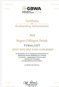
m2超能膠原飲 【第4屆 全球美容與健康大獎】